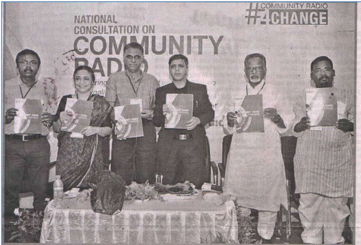
National Seminar on Community Radio organised by Prasar Bharati training institute in Bhubaneswar on Wednesday.