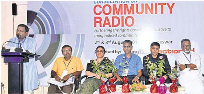
କର୍ମଶାଳାରେ ଯୋଗ ଦେଇଥିବା ଅତିଥିମାନେ।

କୌଣସି ସମସ୍ୟାର ସମାଧାନ ପାଇଁ ଲୋକଙ୍କୁ ଏକାଠି କରିବା କିମ୍ବା ସଚେତନ କରାଇବାରେ କମ୍ୟୁନିଟି ରେଡ଼ିଓ ଏକ ପ୍ରଭାବଶାଳୀ ମାଧ୍ୟମ। ଅବହେଳିତ ବର୍ଗଙ୍କ ସ୍ୱରକୁ ଲୋକଲୋଚନକୁ ଆଣିବା ଏବଂ ସେମାନଙ୍କ ସ୍ୱାର୍ଥରକ୍ଷା କ୍ଷେତ୍ରରେ ଏହା ପ୍ରହରା ସଦୃଶ କାମ କରିଥାଏ। ପ୍ରସାର ଭାରତୀ ତାଲିମ କେନ୍ଦ୍ରଠାରେ ରୁଧିରାଜ ଆରମ୍ଭ ହୋଇଥିବା 'କମ୍ୟୁନିଟି ରେଡ଼ିଓ: ଅବହେଳିତ ବର୍ଗର ଅଧିକାର, ନ୍ୟାୟ ଏବଂ ବିକାଶ ପାଇଁ ସହାୟତା' ଶୀର୍ଷକ ୨ଦିନିଆ ଜାତୀୟ କର୍ମଶାଳାରେ ଏହି ମତପ୍ରକାଶ ପାଇଛି।