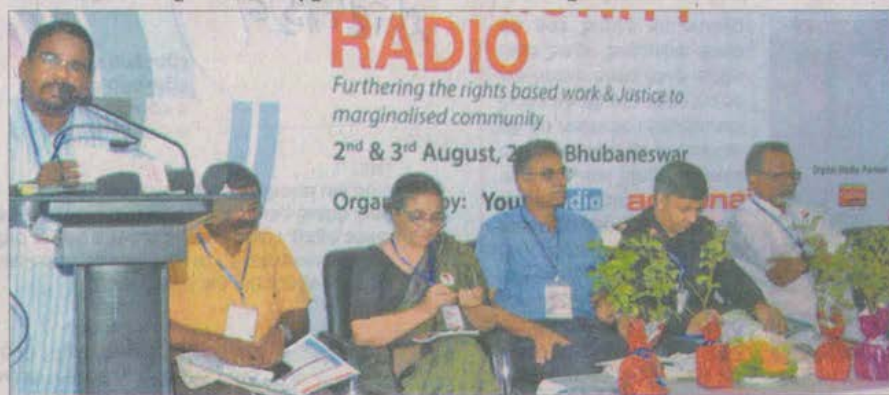
ରେଡିଓର ମହତ୍ୱପୂର୍ଣ୍ଣ ଭୂମିକା ରହିଛି । ଗଣମାଧ୍ୟମର ବ୍ୟାପକ ପ୍ରସାର ସତ୍ତ୍ୱେ ଏବେକି ଭାରତ ବ୍ୟାପୀ